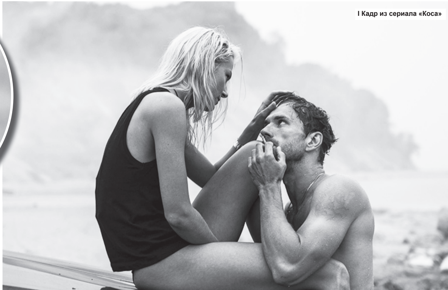
I Кадр из сериала «Коса»

- Он вообще меня привел в мир кинематогра-