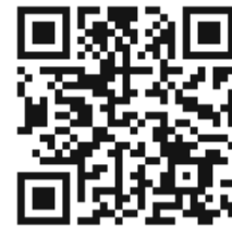
Схема движения автобусов меняется

Аккаунты в социальных сетях: vk.com/yuzhnosakhalinsk_official , facebook.com/yuzhnosakhalinsk , instagram.com/yuzhnosakhalinsk_official