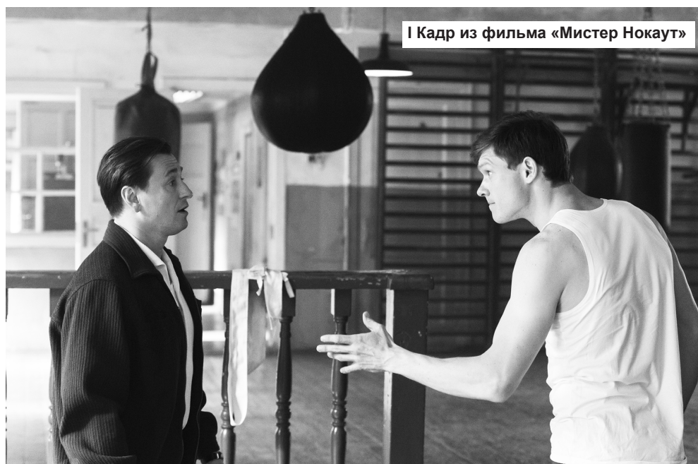
Кадр из фильма «Мистер Нокаут»