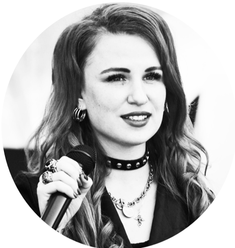
I Валерия Гай Германика